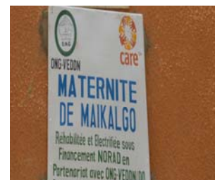
Plaque d'une maternité réhabilitée par l'initiative Men Engage de CARE Niger

Il existe une plus grande sensibilité sociale par rapport à la responsabilité des hommes pour ce qui concerne la santé de la famille, l'éducation des filles, et la bonne nutrition des enfants. Certains hommes ont changé leur perception sur leur rôle et celui des femmes surtout, pour ce qui concerne la facilitation de l'inscription et du maintien des filles à l'école, et l'acceptation du droit des femmes à hériter de la terre au même titre que les hommes.