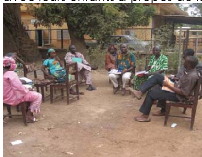
Le personnel de CARE Mali en échanges sous l'arbre à palabres

Le personnel masculin affirme avoir eut un prise de conscience par rapport aux inégalités des sexes. Suite à cette prise de conscience, ils déclarent qu'ils font des tâches qui étaient réservées aux femmes (laver les enfants, faire le lit, etc.), qu'ils ont abandonné des pratiques néfastes telles que l'excision, et qu'ils discutent avec leurs enfants à propos de la sexualité.