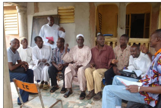
Discusión de Grupo Focal Piloto con hombres de Bamako